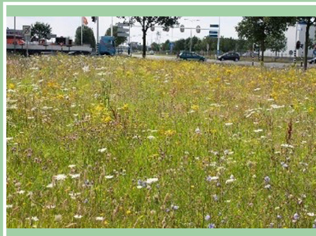
• Bloemrijk gras zaaien