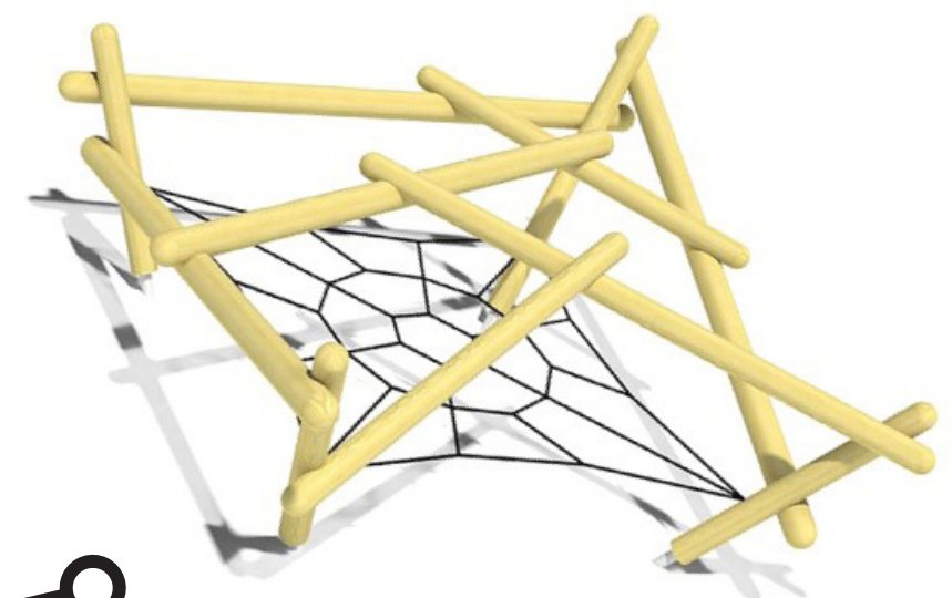
• Vangnet op talud heuvel en palen om te klimmen