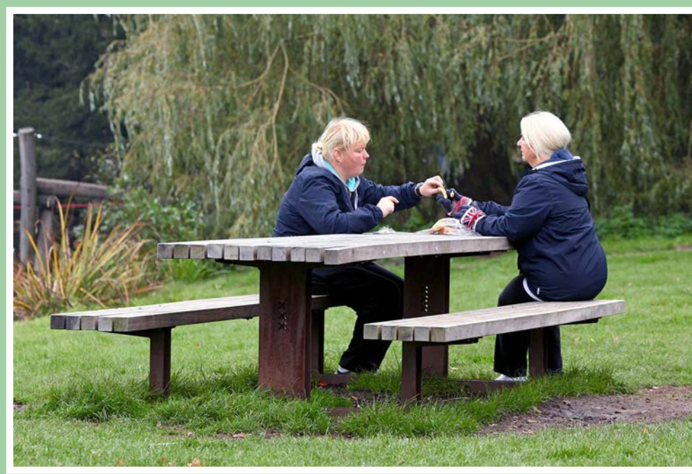
• Picknickbank onder de bomen toevoegen