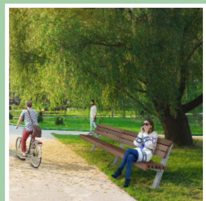
• Zitbank toevoegen