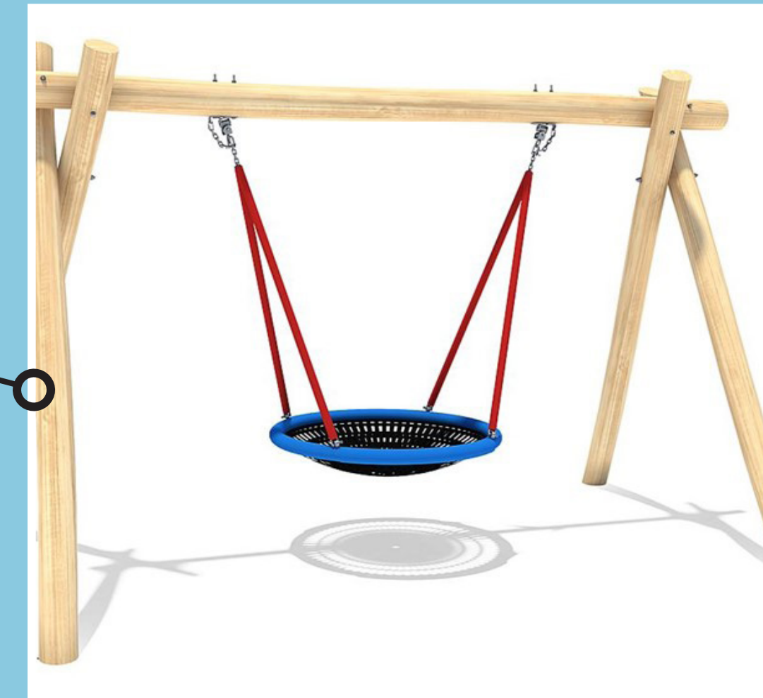
• Groter nest in bestaande schommel