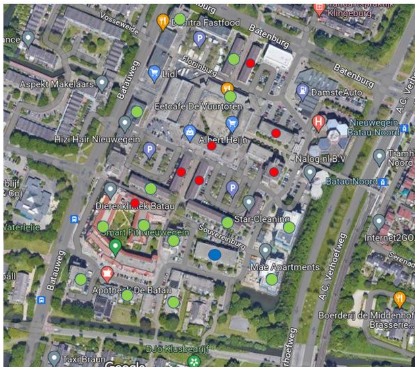
Figuur 2 - (Pogingen tot) interviews in de Muntenbuurt, eerste meting.

Om tot een brede vertegenwoordiging van bewoners te komen, hebben we op twee momenten (een ochtend en een middag) random bij woningen aangebeld met de vraag of mensen wilden meewerken aan een interview. We streefden naar één tot drie interviews per gebouw in de Muntenbuurt. Dit is slechts gedeeltelijk gelukt. Niet in alle gebouwen troffen we bewoners thuis én bereid mee te doen. Bij de gebouwen met een rood bolletje in figuur 2 beantwoordden bewoners de intercom niet, of wilden ze niet meedoen aan het onderzoek. In de gebouwen met een groen bolletje is het wel gelukt om één, twee of drie bewoners te interviewen.