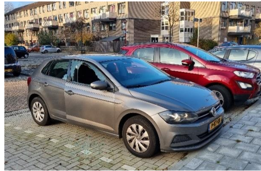
Foto 2 - Opeengebroken auto

Conclusies m.b.t. veiligheid en overlast Er zijn vanuit de professionals al de nodige acties ingezet, maar bewoners ervaren nog steeds overlast door criminaliteit en drugsgebruik, afval op straat, hondenpoep, snel rijdende auto's en scooters en hangjongeren. Een deel daarvan wordt ervaren op heel concrete plekken in de Muntenbuurt. Mensen melden overlast niet altijd. Ze proberen er zelf soms wat aan te doen, maar durven dat soms ook niet.