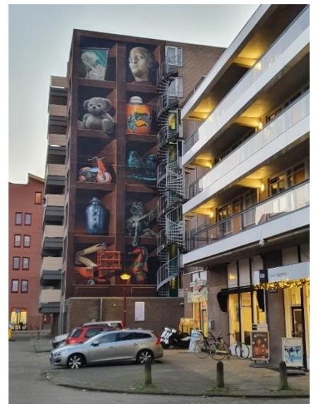
Foto 4 - Eén van de nieuwe muurschilderingen in de Muntenbuurt.