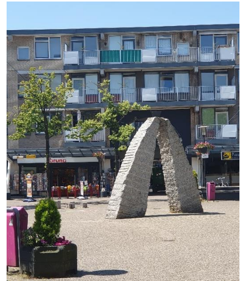
Foto 1 - Muntplein

Uit het onderzoek bleek dat 40% van de bezoekers 60 jaar of ouder is, en er komen meer vrouwen (76%) dan mannen (24%). De zitgelegenheiten op het plein scoren 'gemiddeld' en zowel de kwantiteit als de kwaliteit van speelgelegenheiten kreeg een onvoldoende. Het deel van het plein waar de Albert Heijn zich bevindt, wordt meer bezocht dan andere delen. Ook bleek een opvallend verschil in beleving tussen mensen die de enquête op het plein invulden vergeleken met mensen die de enquête op afstand online hebben ingevuld. Mensen die de enquête op het plein invulden, ervoeren het plein over het algemeen als 'gezellig, fijn en functioneel' , terwijl mensen die de enquête digitaal invulden aangaven het plein 'saai, ongezellig en stenig' te vinden.