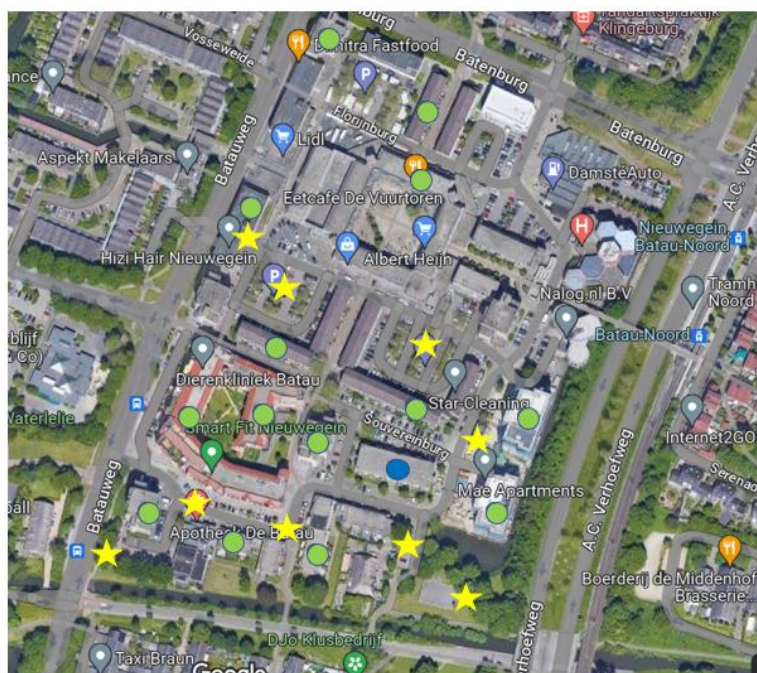
Figuur 3 - Plekken waar mensen zich onveilig voelen of overlast ervaren (gele sterren) t.o.v. waar mensen geïnterviewd zijn (groene en blauwe bolletjes).

Legenda: ● in dit gebouw zijn 1, 2 of 3 bewoners geïnterviewd ● in dit gebouw vond de focusgroep in de buurtkamer plaats ★ plekken waar mensen zich onveilig voelen of overlast ervaren